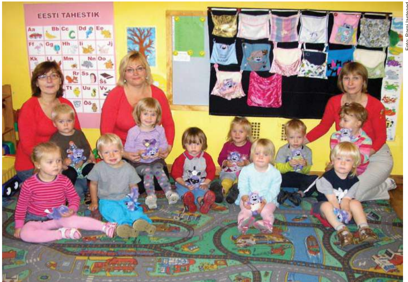
Positiivne keskkond: Mesimummirühma lapsed koos õpetajatega.

Käitumismustrid ei muutu kiiresti, seepärast peaksid lasteaed ja kodu tegema koostööd. Kui laste koosolekutel lapsed arutlevad mõne teema üle, siis õpetajad kirjutavad laste mõtted üles suurele paberile. See leht riputatakse rühma üles, et ka lapsevanemad näeksid, millest on ves-