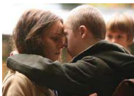
Café de Flore